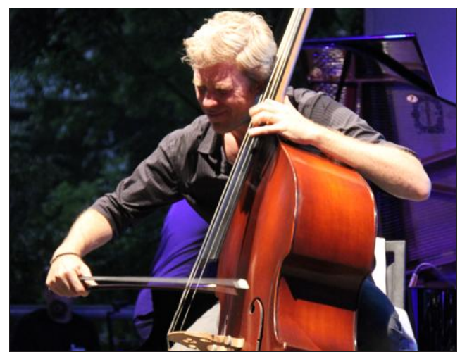
La peinture américaine Kyle Eastwood a conclu le festival avec son quintet.

Cette année, la diversité de la programmation a ravi les passionnés de jazz mais également les novices avec un mélange entre différents courants ainsi que des artistes de renom et d'autres régionaux.