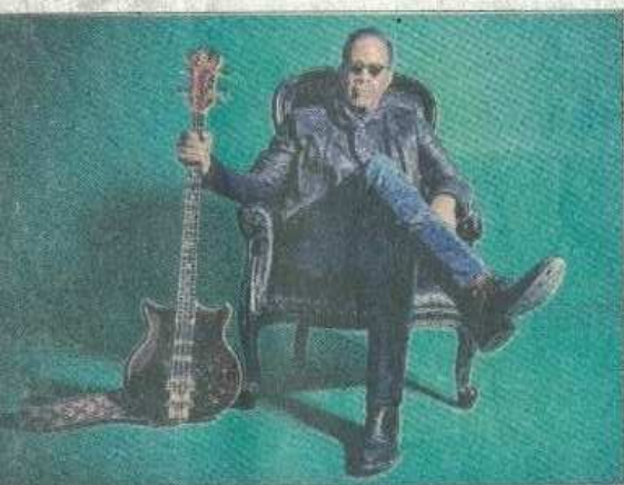
Stanley Clarke présentera son dernier opus, "Basic collection" dans les bacs depuis le 26 avril.